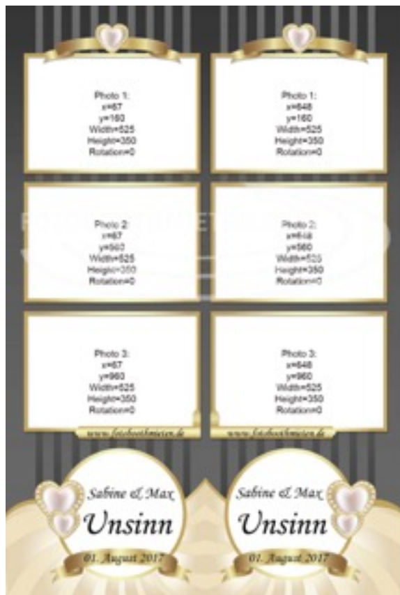
Maße des 3er Filmstreifen