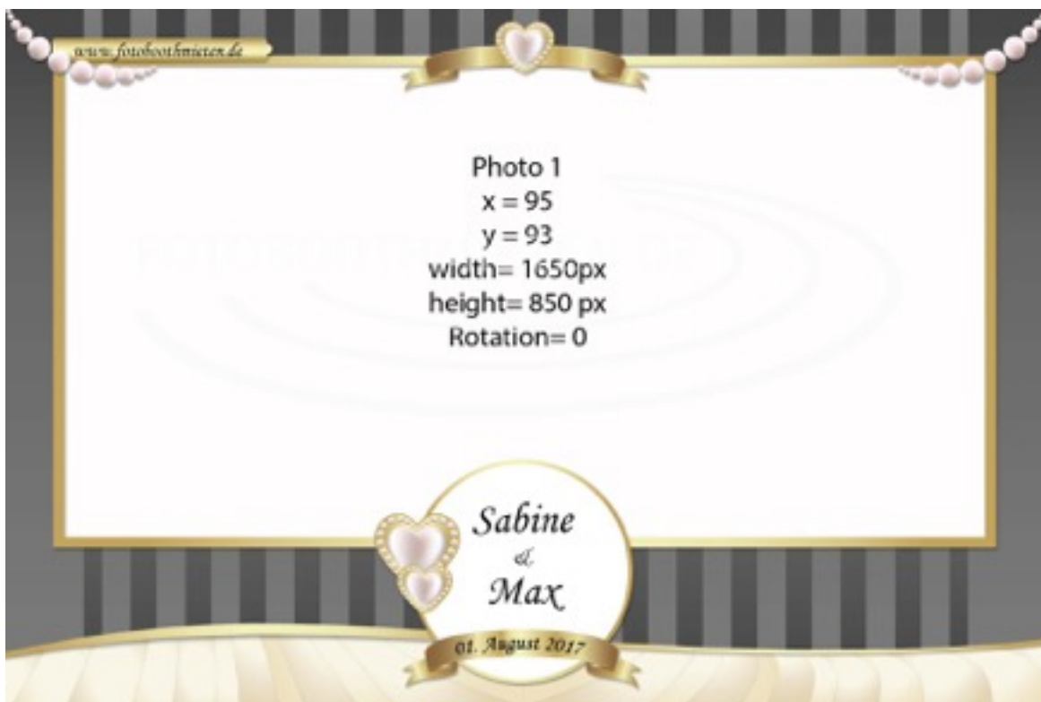
Maße des Einzelbildes

Jetzt aber viel Spaß beim Erstellen Deines eigenen Layout.