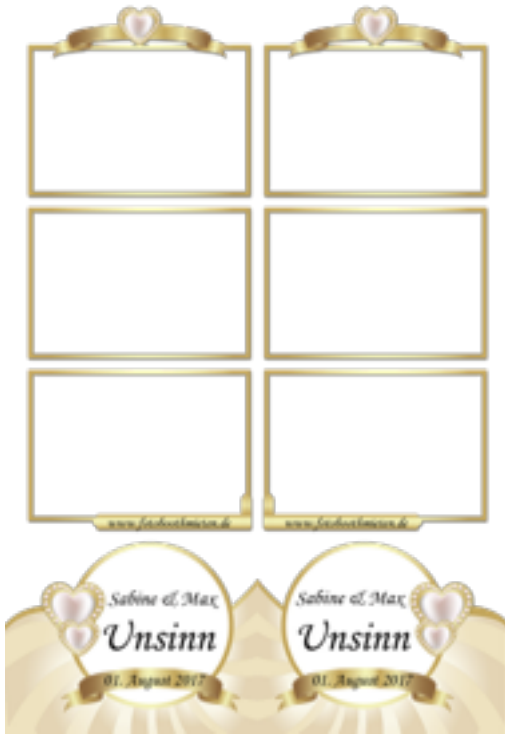
overlay des 3er Filmstreifen