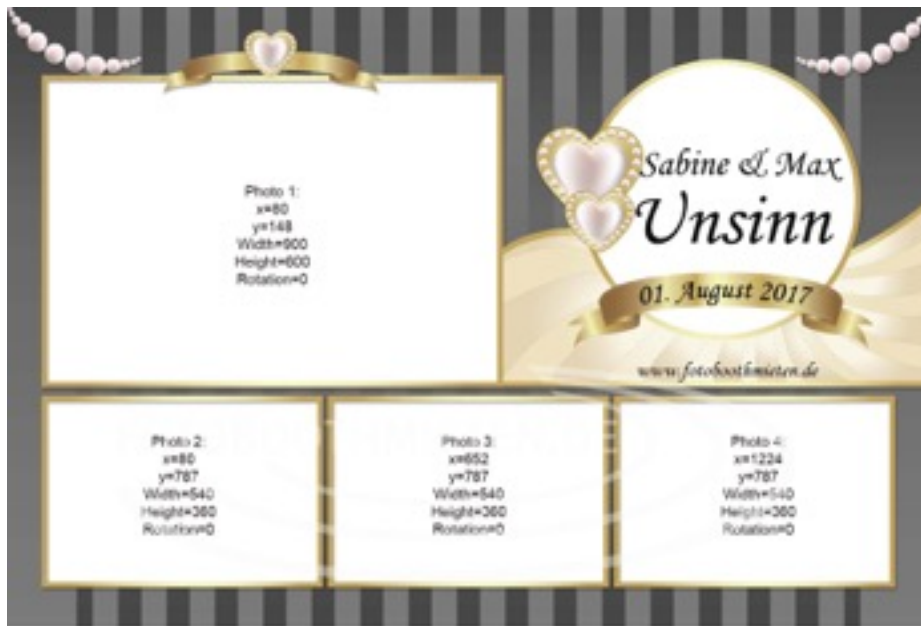
Maße des 4er Multilayout